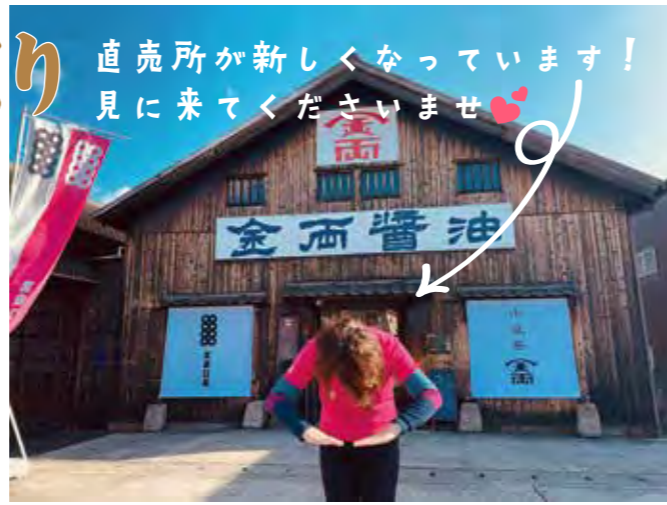
金両醤油 五代目当主 藤井寿美子