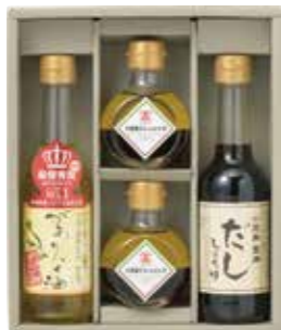
小豆島ドレッシング2本