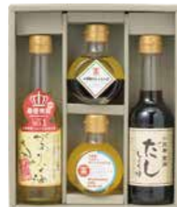
ソルティ ガーリックオイル入